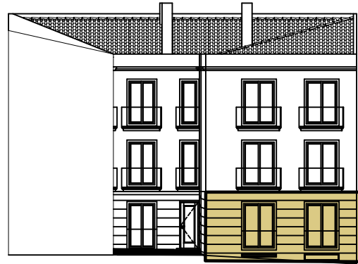
S/ Escala - Alçado Principal