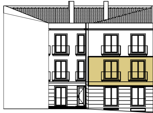
S/ Escala - Alçado Principal